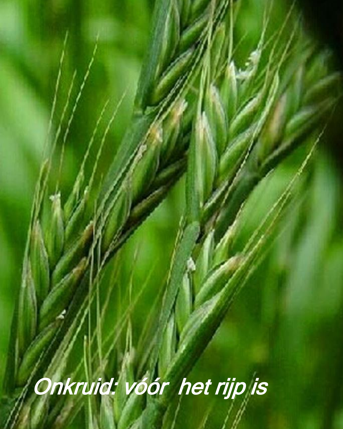
Onkruid: vóór het rijp is