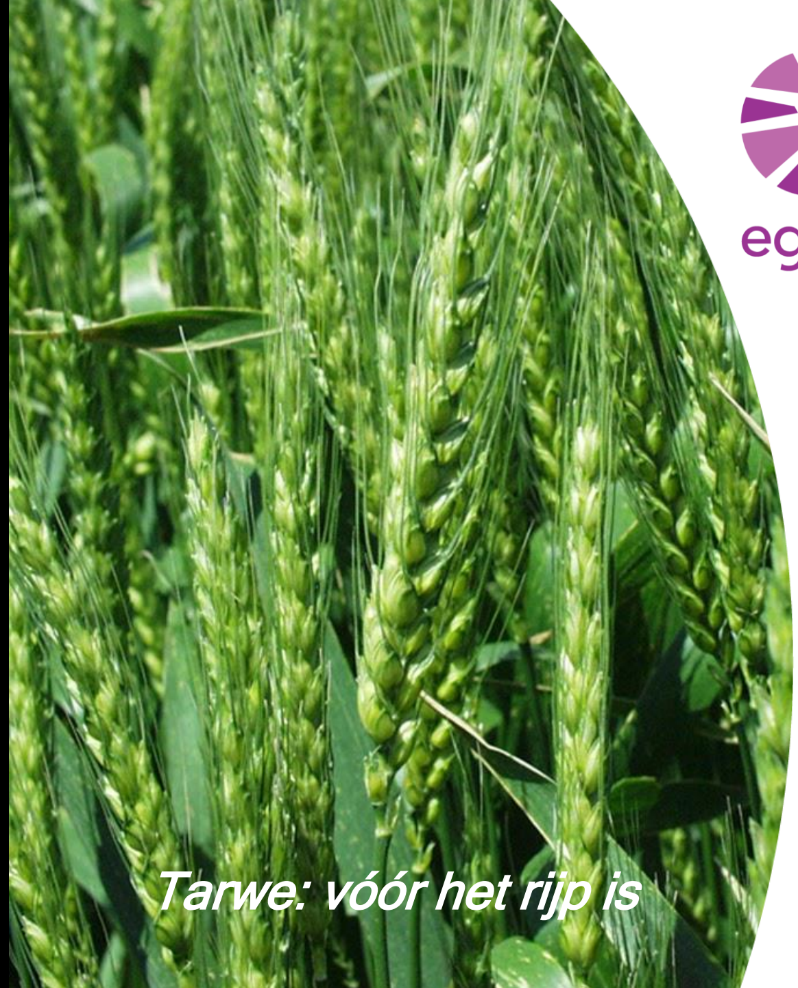
Tarwe: vóór het rijp is